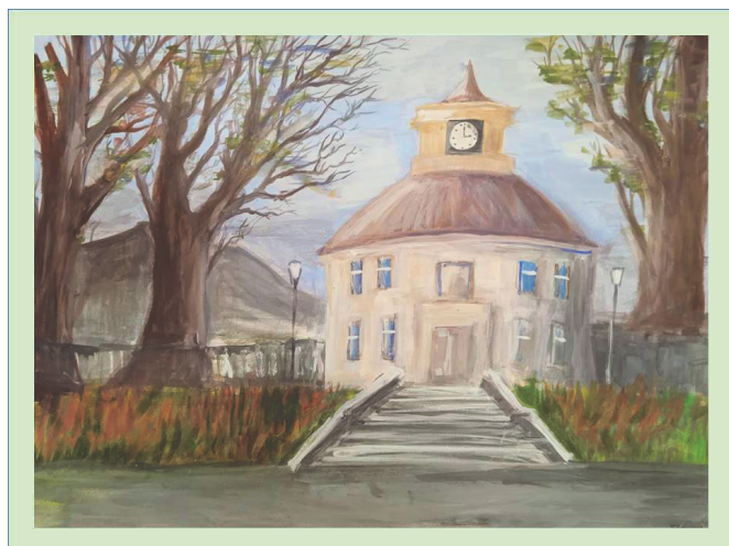
Дом-графин. Софья Чигирева, 12 лет.

Эти рисунки были созданы учащимися Детской школы искусств к 360-летию поселка под руководством преподавателя Ольги Мягковой.