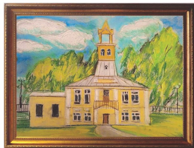
Здание волостного правления. Денис Чепурнов, 17 лет.