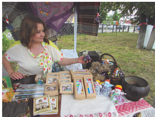
Сувениры, сделанные в том числе и своими руками, от историко-краеведческого музея.