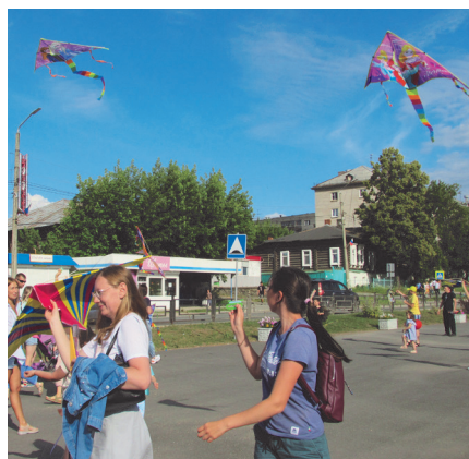
Запуск воздушных змеев вызвал восторг не только детворы, но и взрослых.

В этот день на территории культурно-исторического центра округа было организовано множество различ-